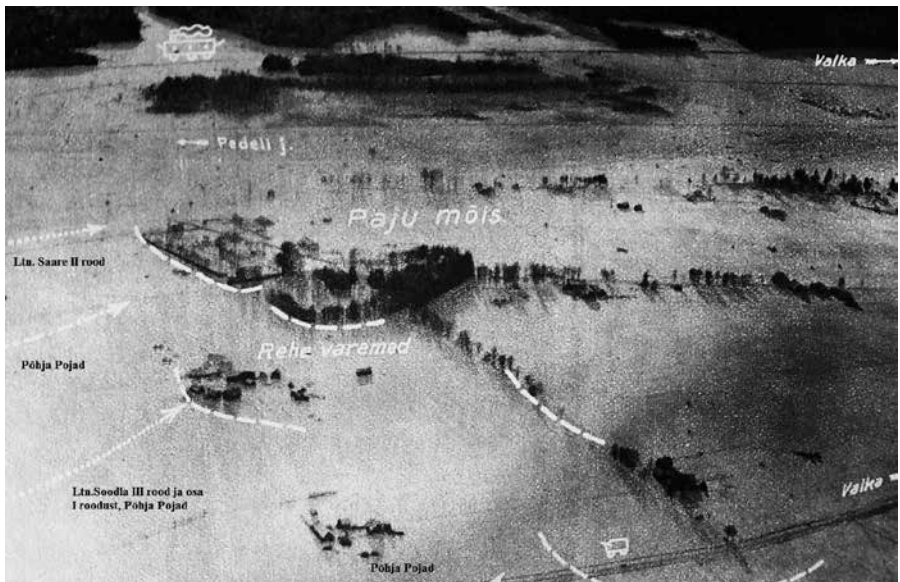
Foto 2. Õhufoto. Varahommikusest tugevast kahuritulest ning ühisrünnakust oleks piisanud, et verine Paju lahing jäänuks üldse olemata. Ooberst Kalm käskis kuperjanovlastel ja soomlastel rünnata Paju mõisa päise päeva ajal, mil päike paistis otse silma. Soomlaste rünnakusihetidel puudusid ka looduslikud kaitseobjektid nagu need olid kuperjanovlastel, mistõttu soomlasi hukkus ka palju enam.

Leitnant Saare 2.rood rivistus ahelikku ja oli valmis pealetungiks mõisale raudtee äärsest metsatukast (3., lk.20), jäädes seejuures vastase soo-